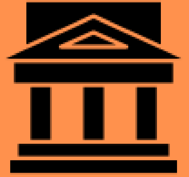
The Supreme Court

Revisa las decisiones de los tribunales federales, estatales y de apelación. Las citas en estos casos incluyen "U.S", "S.Ct" o "L.ed.". Los fallos de esta Corte dirán "Suprema Corte de los EE.UU." en la parte superior. Las decisiones emanadas de la misma deberán ser acatadas por el resto de los tribunales en EE.UU.